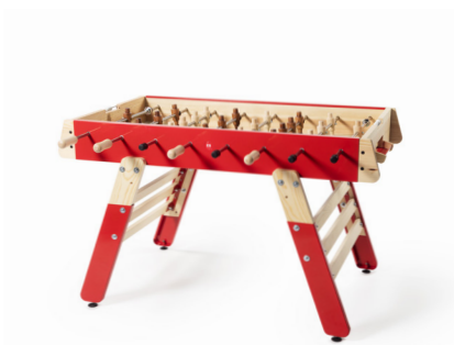
— RS#4Fun — RAFAEL RODRÍGUEZ