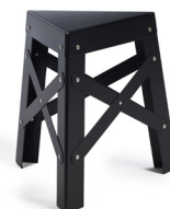
— Eiffel Aluminium — SHIGEKI FUJISHIRO