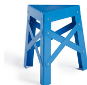
— Eiffel kids — SHIGEKI FUJISHIRO