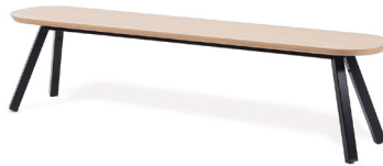
— You and Me bench — ANTONI PALLEJÀ OFFICE