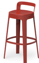
— Ombra stool — EMILIANA DESIGN STUDIO