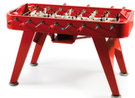
— RS#2 — RAFAEL RODRÍGUEZ