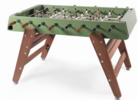
— RS#3 Wood — RAFAEL RODRÍGUEZ