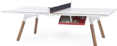
— You and Me — ANTONI PALLEJÀ OFFICE

YOU ALSO MAY LIKE: TAMBIÉN TE PODRÍA GUSTAR: