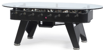
— RS#Dining Table — JOSÉ ANDRÉS + RAFAEL RODRÍGUEZ