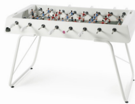
— RS#3 — RAFAEL RODRÍGUEZ