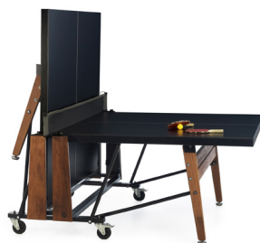
— RS#PingPong Folding — RAFAEL RODRÍGUEZ